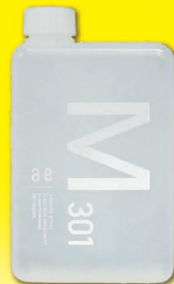
M301 1L ¥13,970